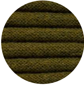
Gras / Pine